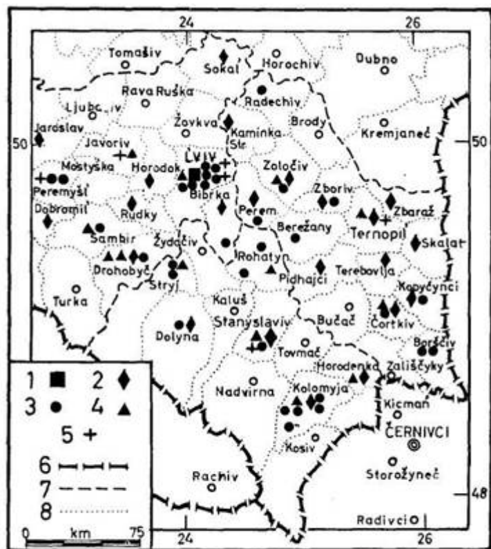
Т-во «Рідна Школа» у Львові 1938 1 — Центральна. 2 — Пов. союзи кружків. 3 — Нар. школи. 4 — Сер. школи. 5 — Фахові школи. 6 — Кордони держав. 7 — Межі воєводства. 8 — Межі повітів

Українське Педагогічне Товариство, осв.-виховне т-во, засноване 1881 у Львові, як «Руське Товариство Педагогічне», з завданням: