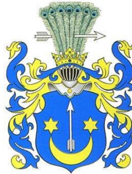
Герб роду Сасів

Зосередження такої кількості талановитих адвокатів у Дрогобичі зумовлювалося тим, що місто було центром нафтового промислу; тут знаходилися нафтові фірми, що забезпечували високооплатність справ.